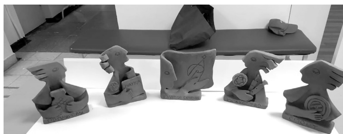
Эти статуэтки отражают каждое направление Золотого сечения — наука, промыслы, спорт и искусство

подарило массу положительных эмоций и впечатлений!