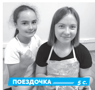
ПОЕЗДОЧКА 5 с.